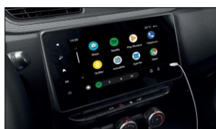
Easy Link 8" display