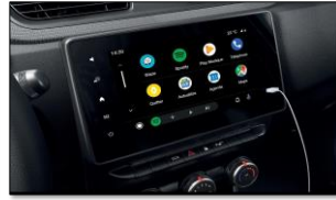
Easy Link 8" display