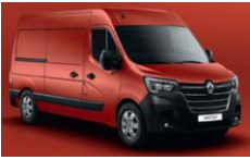
719 RØD MAGMA