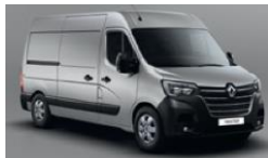
KNH STAR GREY