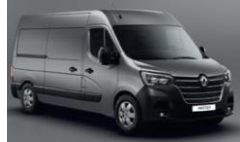
KPW URBAN GRÅ