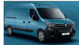
423 BLÅ SAVIEM