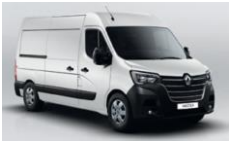
QNG MINERAL HVID