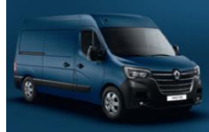
RNQ BLÅ VOLGA