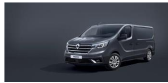
COMET GRÅ Ej H2