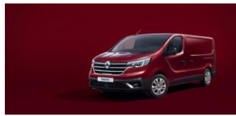
CARMIN RØD Ej H2