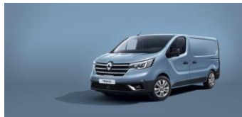
CUMULUS BLÅ Ej H2