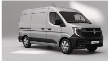
SORT PEARL BLACK