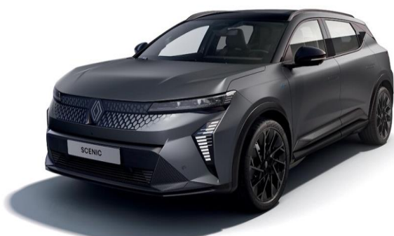
Grå Schiste Mat