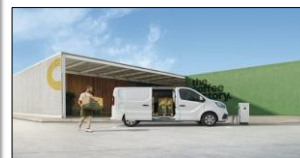
Lastvolumen på 6,7 m 3 L2H1 og lastlængde op til 4150 mm

Priser, specifikationer og udstyr er af vejledende art og kan ændres uden varsel af RN Danmark, og der tages forbehold for trykfejl. Ekstraudstyr kan være forbeholdt visse versioner og skal evt. kombineres med andet udstyr. Kontakt din Renault forhandler. RN Danmark, en filial af RN Nordic AB - Industriparken 21A, 1. sal - 2750 Ballerup. www.renault.dk