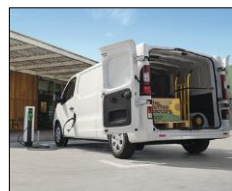
Lastvolumen på 6,7 m 3 L2H1 og lastlængde op til 4150mm