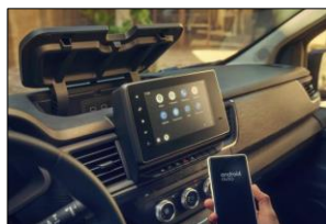
EasyLink 8" med smartphonespejling

(1) Afhængigt af kørestilen. (2) Brændstofforbrug og CO2-emissioner er beregnet på baggrund af en standardreguleringsmetode. Metoden er ens for alle bilproducenter og gør det muligt at sammenligne biler. (3) WLTP (Worldwide Harmonized Light Vehicles Test Procedures): I forhold til NEDC-protokollen viser denne nye protokol værdier, der ligger meget tættere op ad de værdier, der gælder under reelle kørselsbetingelser.*22 kW AC lader bortfalder ved valg af 50 kW DC lader **8 år/160.000 km batterigaranti, alt efter hvad der indtræffer først og mindst 70% sundhedstilstand (SOH) garanteret i garantiperioden.