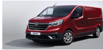
RØD - Carmin