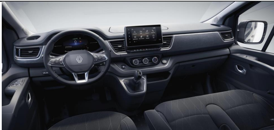
Inspirationsbillede hvor der blandt andet vises EDC gear, 7" farve display, animeret læderrat m.m.