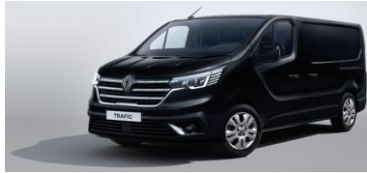
SORT - Midnat