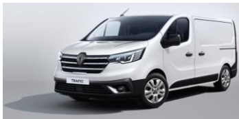
HVID - Mineral