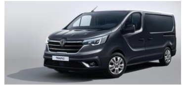
GRÅ - Comet