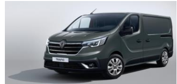
GRÅ - Urban