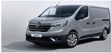
GRÅ - Highland