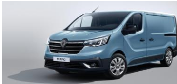
BLÅ - Cumulus