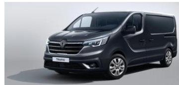
GRÅ - Comet