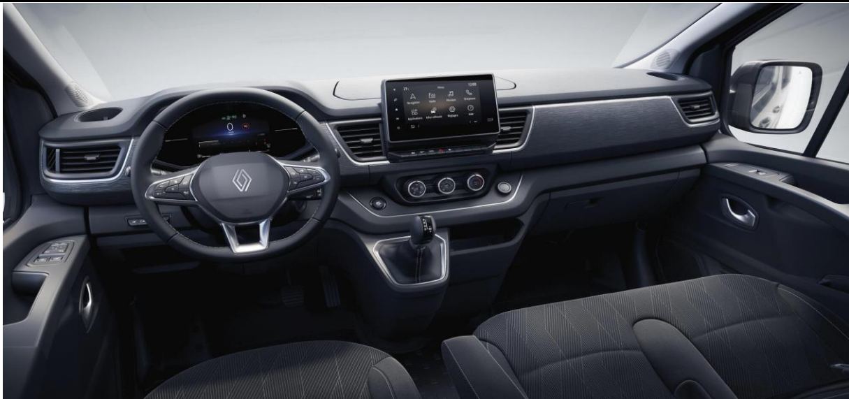
Inspirationsbillede hvor der blandt andet vises EDC gear, 7" farve display, animeret læderrat m.m.