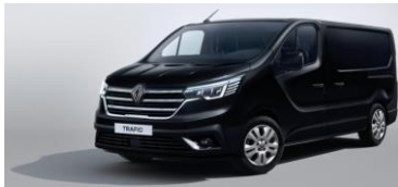
SORT - Midnat