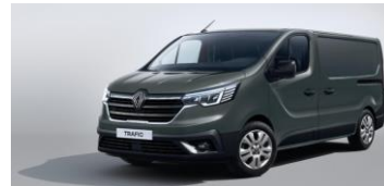
GRÅ - Urban