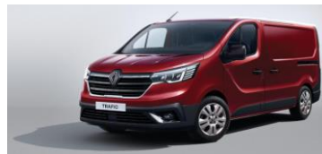
RØD - Carmin