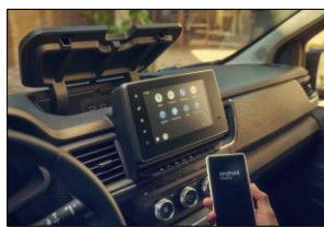
EasyLink 8" med smartphonespejling

(1) Afhængigt af kørestilen. (2) Brændstofforbrug og CO2-emissioner er beregnet på baggrund af en standardreguleringsmetode. Metoden er ens for alle bilproducenter og gør det muligt at sammenligne biler. (3) WLTP (Worldwide Harmonized Light Vehicles Test Procedures): I forhold til NEDC-protokollen viser denne nye protokol værdier, der ligger meget tættere op ad de værdier, der gælder under reelle kørselsbetingelser.*22kW AC lader bortfalder ved valg af 50 kW DC lader