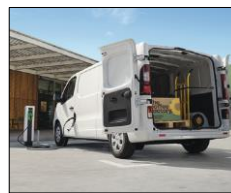
Lastvolume på 6,7 m3 L2H1 og lastlængde op til 4150mm