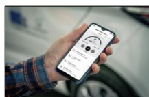
My Renault appen