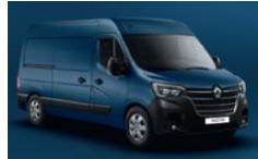
RNQ BLÅ VOLGA