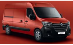
719 RØD MAGMA